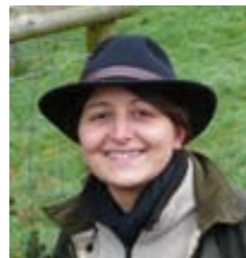
Orane Bienfait Formation et sensibilisation