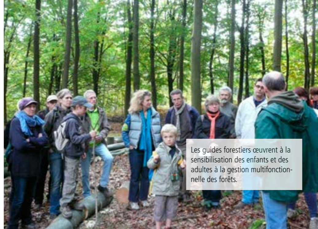
Les guides forestiers œuvrent à la sensibilisation des enfants et des adultes à la gestion multifonctionnelle des forêts.