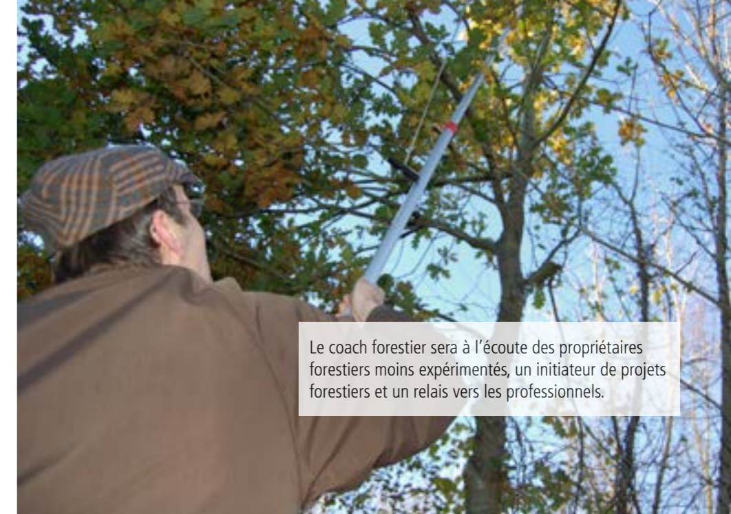
Le coach forestier sera à l'écoute des propriétaires forestiers moins expérimentés, un initiateur de projets forestiers et un relais vers les professionnels.