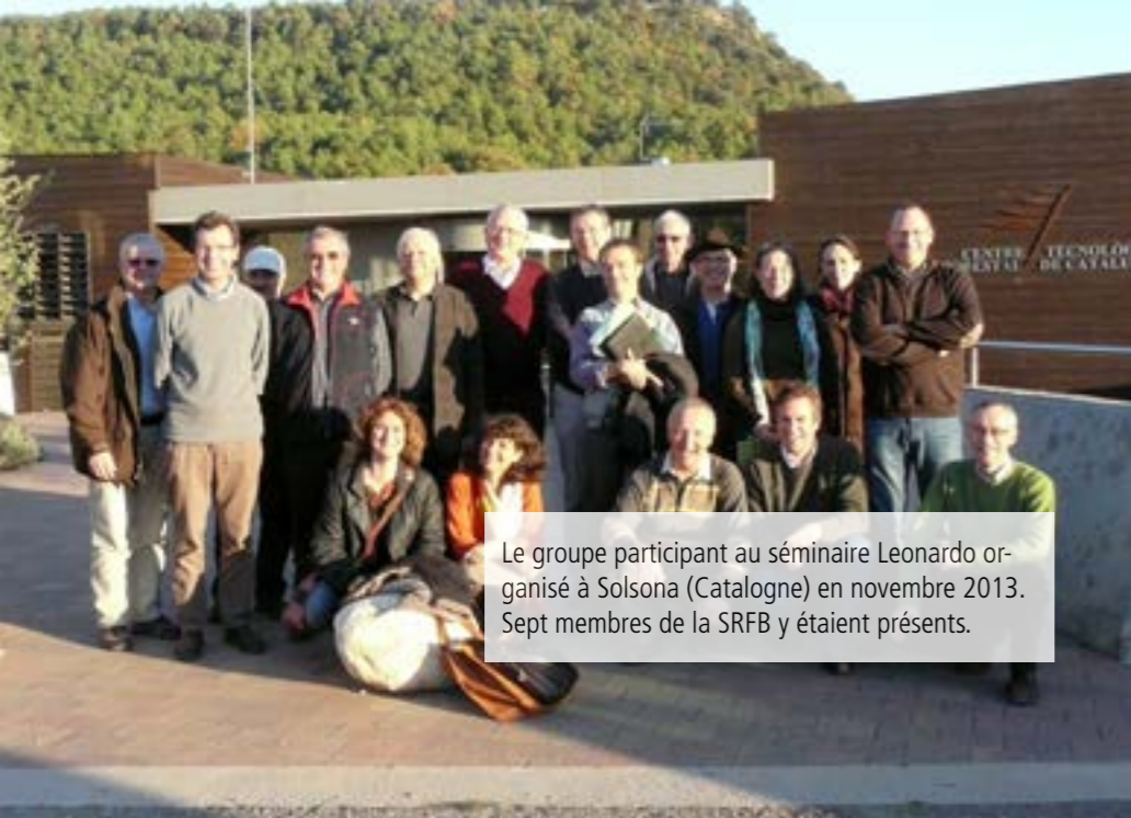
Le groupe participant au séminaire Leonardo organisé à Solsona (Catalogne) en novembre 2013. Sept membres de la SRFB y étaient présents.